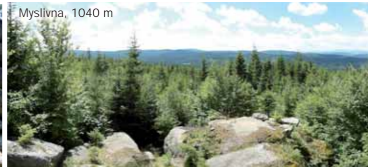
Myslivna, 1040 m