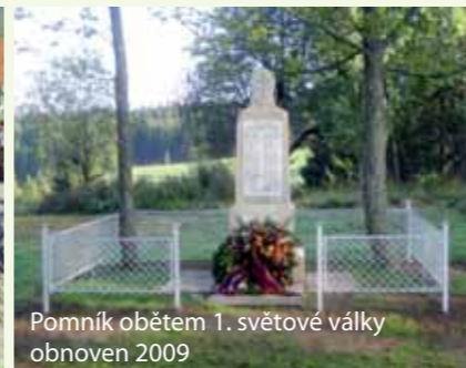
Pomník obětem 1. světové války obnoven 2009