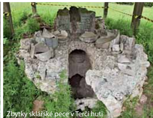
Zbytky sklářské pece v Terčí hutí