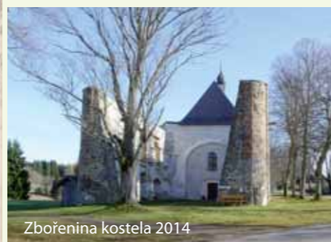
Zbořenina kostela 2014