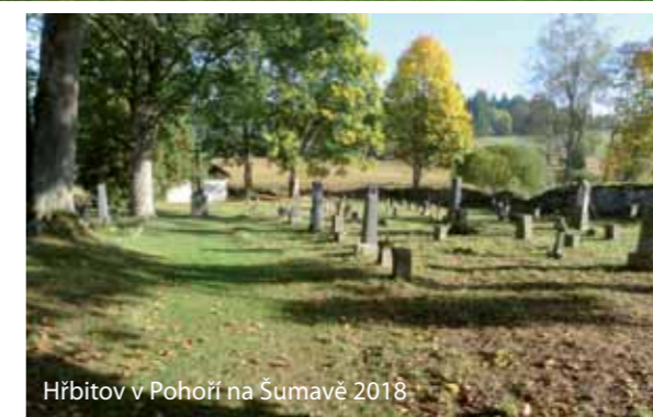
Hřbitov v Pohorí na Šumavě 2018

Roku 2009 byl společně s českým spolkem PIETAS z Velešína na internetu založen virtuální hřbitov mimo jiné i pro obec Pohorí na Šumavě. Na webových stránkách www.pietasamfi.eu mohou potomci nalézt informace o svých zesnulých příbuzných, pokud byly tyto údaje do této doby zapsány. Každý se může u PIETAS přihlásit a zaregistrovat své příbuzné, kteří zemřeli v Pohorí na Šumavě.