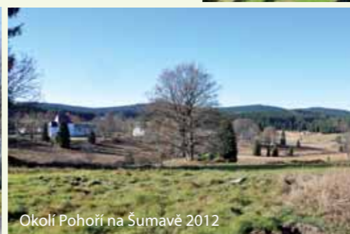
Okolí Pohorí na Šumavě 2012