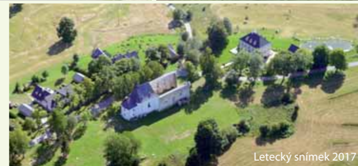
Letecký snímek 2017