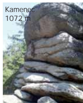
Kamenec 1072 m