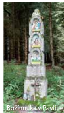
Boží muka v Pavlíně

Náhorní rovina kolem Pohoří na Šumavě nabízí krásné procházky a místa vybízející k zastavení, kde lze načerpat sílu v neporušené přírodě. Rovněž v zimě mohou milovníci sportu a přírody využít možnosti k relaxaci a nabrání nových sil na dobře vyznačených běžeckých tratích.