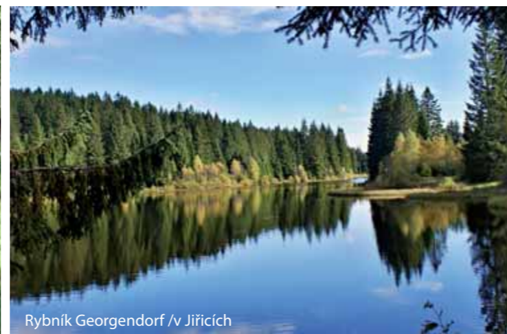
Rybník Georgendorf /v Jiřicích

Náhorní rovina kolem Pohoří na Šumavě nabízí krásné procházky a místa vybízející k zastavení, kde lze načerpat sílu v neporušené přírodě. Rovněž v zimě mohou milovníci sportu a přírody využít možnosti k relaxaci a nabrání nových sil na dobře vyznačených běžeckých tratích.