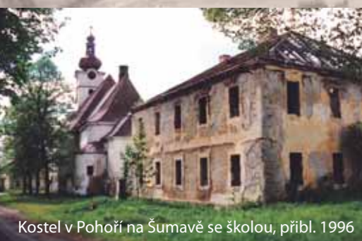
Kostel v Pohorí na Šumavě se školou, přibl. 1996