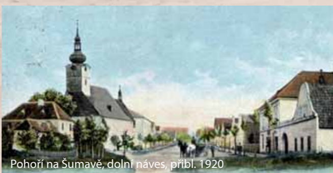
Pohorí na Šumavě, dolní náves, přibl. 1920