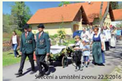
Svěcení a umístění zvonu 22.5.2016

fascinující okolní krajina. Proto bychom chtěli, aby bývalých 11 míst kolem Pohorí bylo spojeno dohromady, a zvláště historický význam tehdejší „výroby skla“, „podmalby na skle“ a „plavení dřeva“.