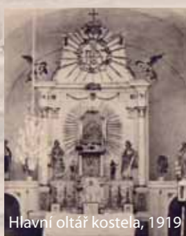
Hlavní oltář kostela, 1919