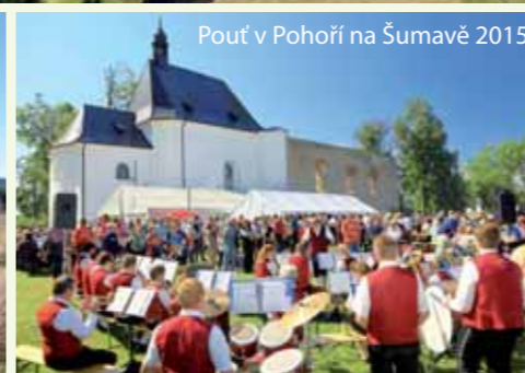
Pouť v Pohorí na Šumavě 2015